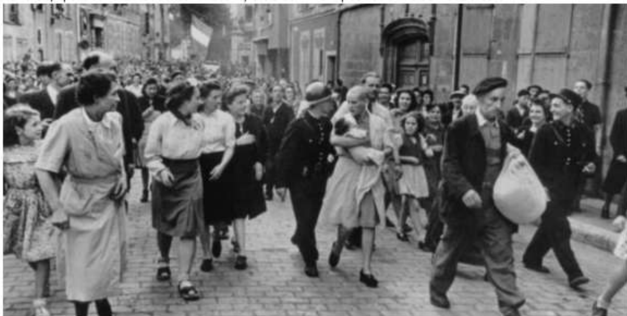
6 août 1944, rue Collin-d'Harleville, à Chartres.

On est coiffeur de père en fils dans la famille Giraud, Pierre, artiste peintre, a repris le salon hommes à la suite de son père, mort dans un camp de travail, Marie sa mère, héroïne de la résistance s'occupe du salon femmes et envoie des modèles à son fils. Le frère, simple candide, particulièrement attendrissant, aide comme il peut à la maison et au salon.