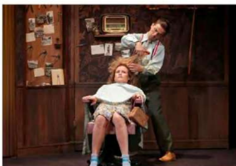
La pièce raconte l'histoire d'un coiffeur qui a dû tondre des femmes sous la pression populaire pendant l'épuration.

Un artiste contraint de reprendre la partie hommes du salon familial après la déportation, sur dénonciation, de son père quand sa mère, elle, coiffe les femmes. Et lui envoie des modèles à peindre... Un jour, vient Lise, une jeune personne au passé flou dont il va s'éprendre.