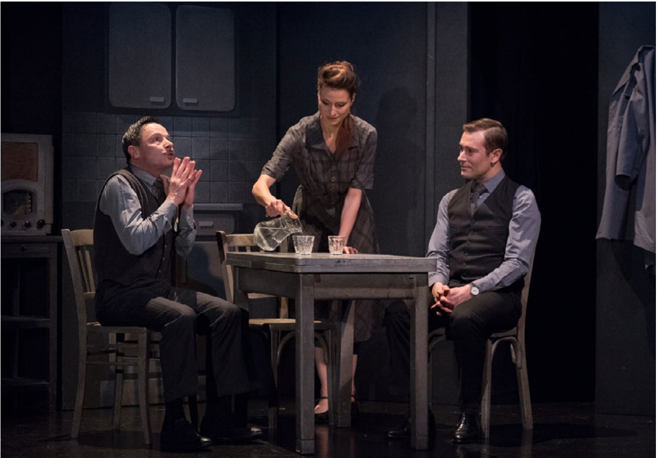
Julie Cavanna / Charles Lelaure / Alexandre Bonstein © Grégoire Matzneff