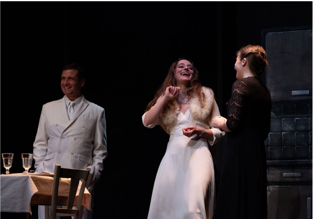
Franck Desmedt / Herrade van Meier / Anne Plantey © Grégoire Matzneff