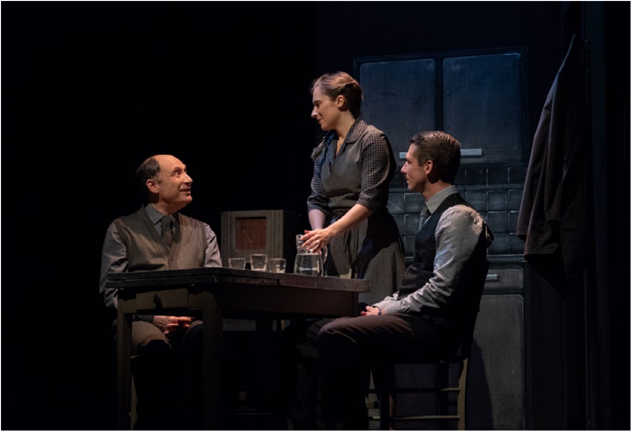
Marc Siemiatycki / Anne Plantey / Benjamin Brenière © Grégoire Matzneff