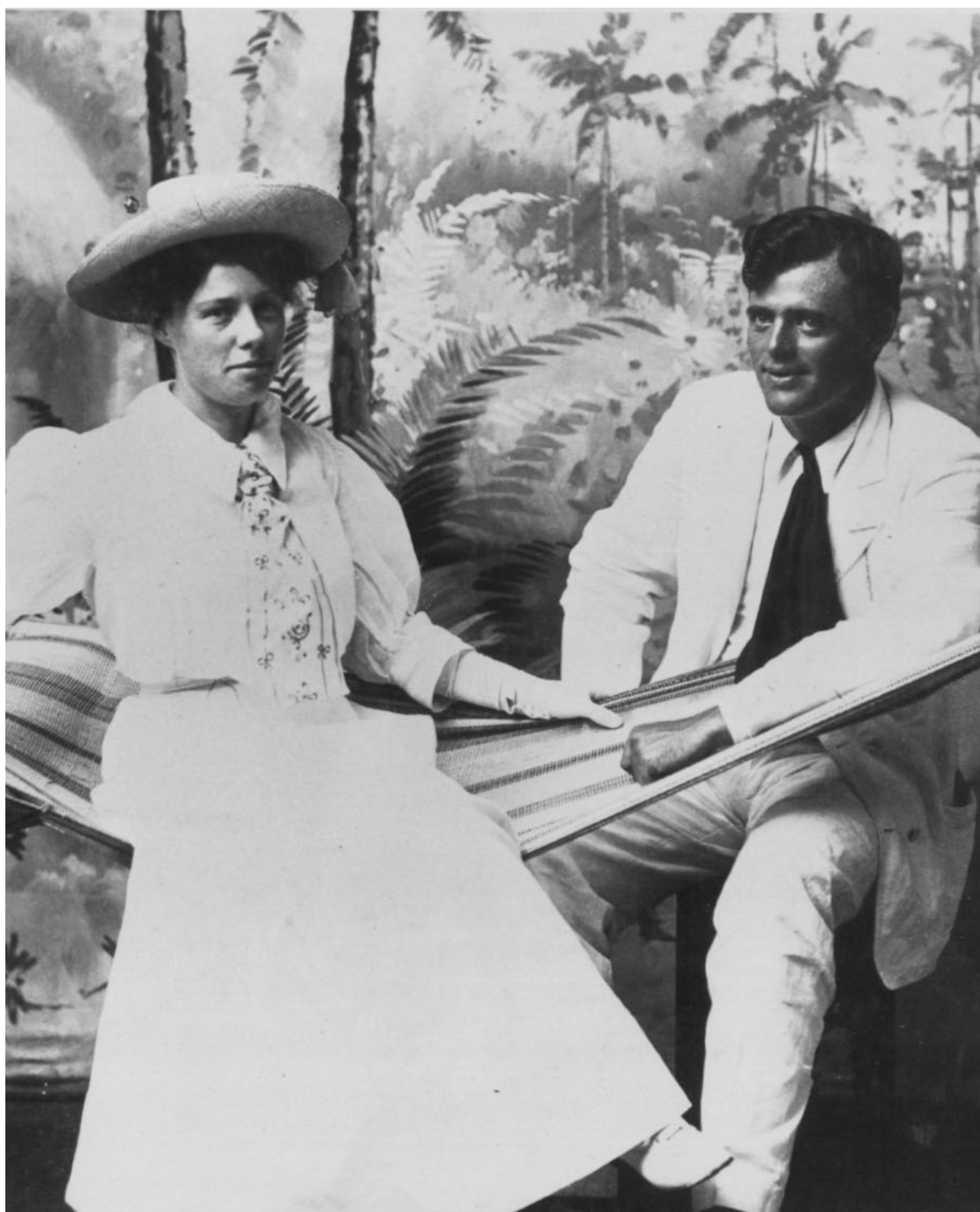
Jack London et Charmian