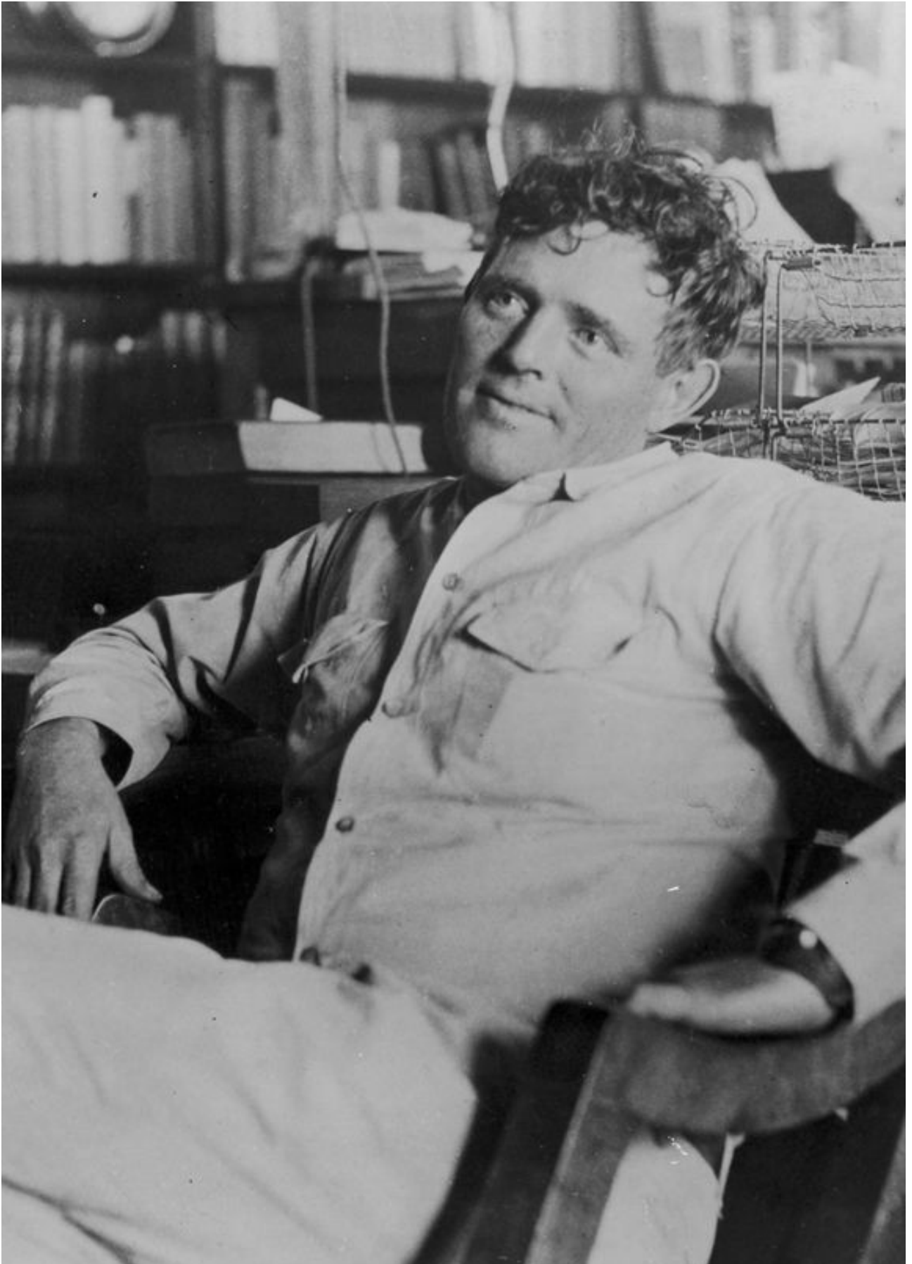
Jack London