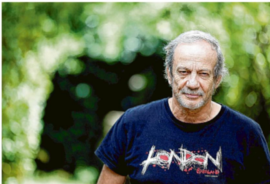
Patrick Chesnais joue jusqu'à dimanche inclus cette pièce connectée à son livre éponyme, "Lettres d'excuses" (L'Archipel).

"Au début de ma carrière, j'étais plutôt valet de comédie fantaisiste, je recherchais la comédie, faire rire. Peu à peu, les expériences forment un statut différent, et j'ai depuis la chance qu'on me propose des choses qui ne se ressemblent pas. Pour interpréter des personnages, on se sert de ce qu'on est. On appuie sur des boutons différents à l'intérieur. Être acteur, c'est regarder le monde, les gens, s'en inspirer, être une éponge de la condition humaine, accumuler les rencontres. On se glisse là-dedans en fonction de ses propres expériences. Être acteur, pour moi, ce n'est surtout pas faire des exercices de diction dans un