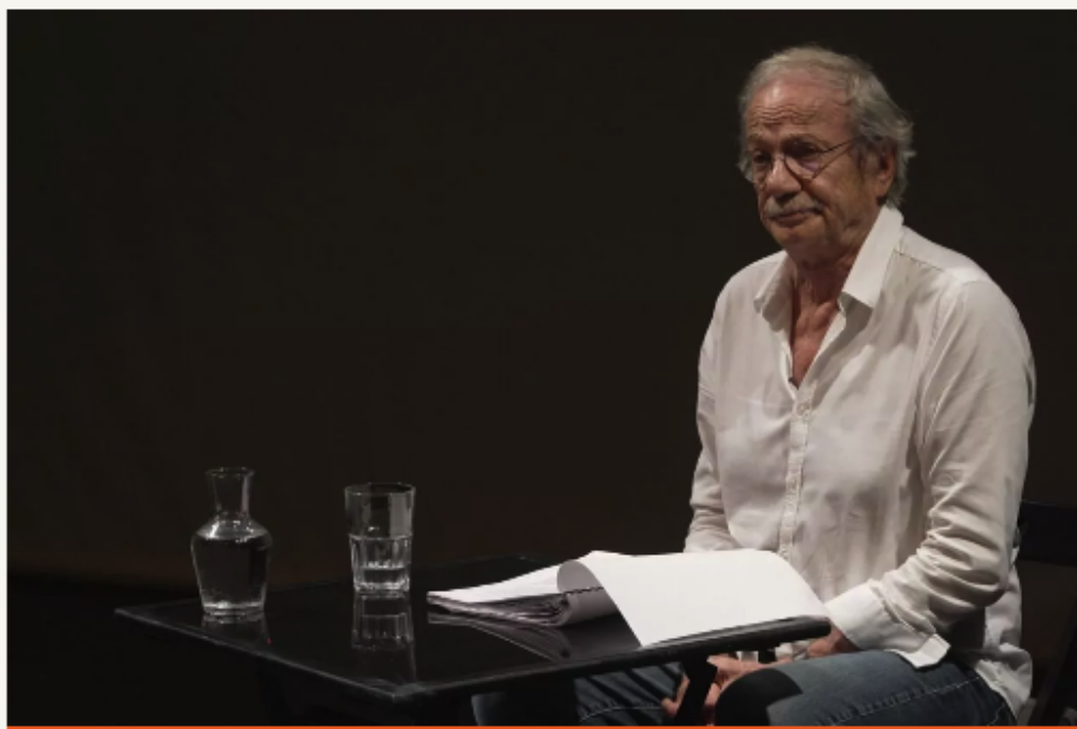
Patrick Chesnais dans "Lettres d'excuses".

À l'occasion de sa venue à la Fnac d'Avignon, L'Éclaireur s'est entretenu avec le comédien Patrick Chesnais autour de son nouveau spectacle, Lettres d'excuses , présenté durant le Festival qui a lieu actuellement dans le sud de la France.