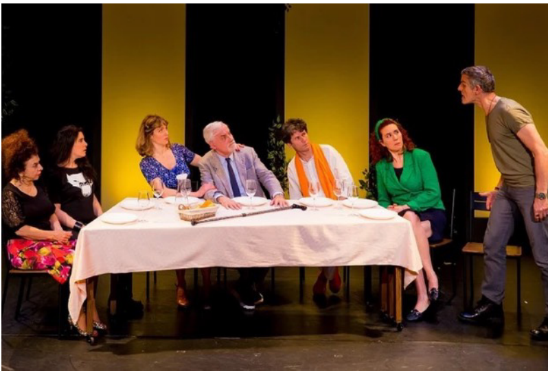
Le retour de Richard 3 par le train de 9h24

Parce qu’il se sait atteint d’une maladie incurable et qu’il voudrait renouer avec sa famille dont il s’est éloigné, Pierre-Henri , ancien publicitaire, décide de convoquer une troupe d’acteurs à qui il demande d’interpréter femme, sœur, ami et enfants.